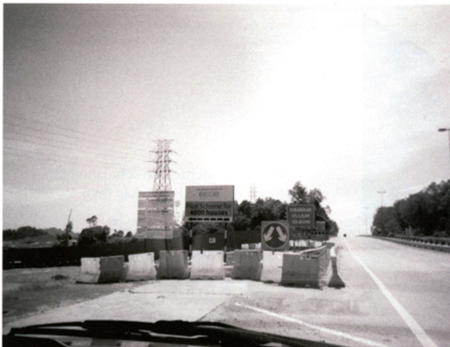
Borneo Maker onbekend