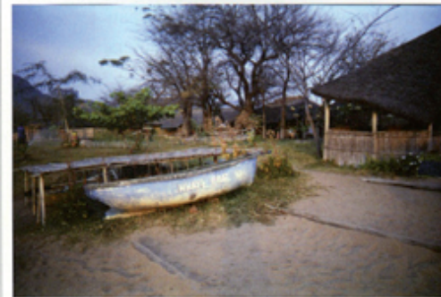
België Chris Peeters

“Ik wilde een eerlijk en puur beeld scheppen en niet als verkapt boodschappenluik fungeren”